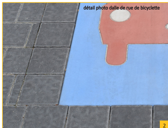
détail photo dalle de rue de bicyclette

Cette dalle de signalisation est basée sur le panneau de signalisation E1.